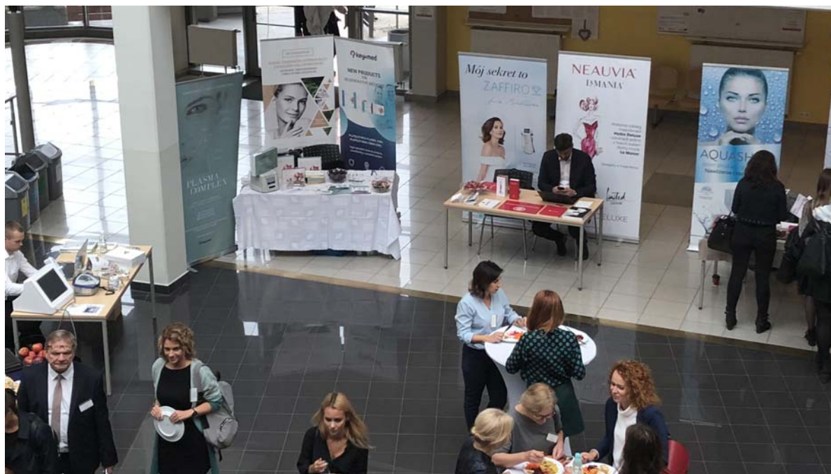
▲ Figure 3. Kącik wystawców – przerwa obiadowa