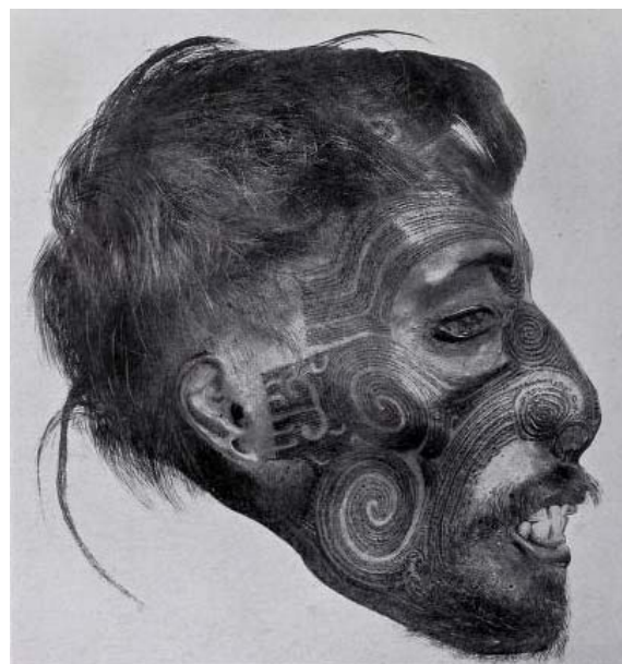
▲ Figure 2. Maori head tattooed, EW Clark collection. Source: Sebbelov G. 1912 ▲ Rycina 2. Wytatuowana głowa Maorysów, kolekcja EW Clark, Źródło: Sebbelov G. 1912