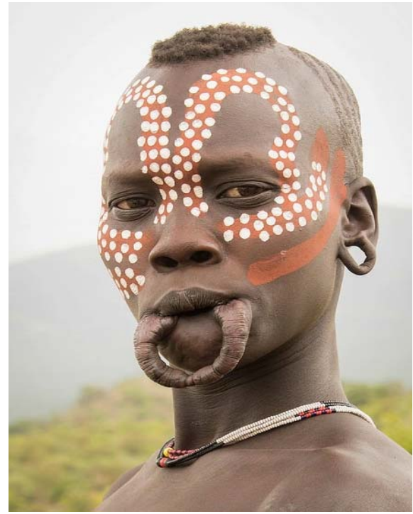
▲ Figure 3. Women of the Mursi tribe, https://cultinera.wordpress.com/2019/09/21/los-mursi/#jp-carousel-5522 ▲ Rycina 3. Kobiety z plemienia Mursi, https://cultinera.wordpress.com/2019/09/21/los-mursi/#jp-carousel-5522

incisors knocked out. In everyday life, however, they do not wear clay discs all the time, as a result of which the lower lip droops, revealing the missing teeth [9].