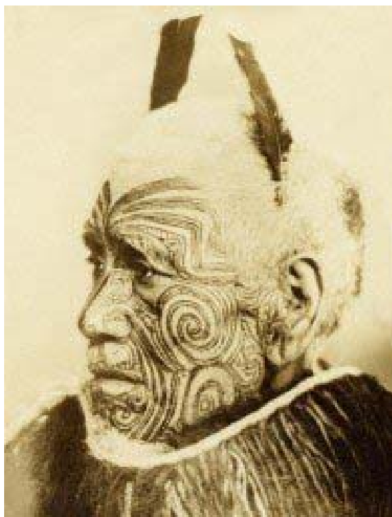
▲ Figure 1. Polynesian tattoo, https://www.polynesia.com/blog/ta-moko-maori-tattooing ▲ Rycina 1. Tatuaż polinezyjski, https://www.polynesia.com/blog/ta-moko-maori-tattooing

Wyjątkowego znaczenia nabral tatuaż w Japonii, gdzie po raz pierwszy został zastosowany w celach penitencjarnych - jako symbol kary za dokonane przewinienia i stosowany aż do XVII wieku w postaci zarówno znaku na czole „kanji inu” (pies). Rzymianie i Grecy także wykorzystywali taką formę modyfikowania cia-