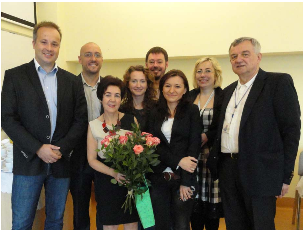
▲ Figure 2. Team of employees of Oral Rehabilitation Department at PUMS (2012) ▲ Rycina 2. Zespół pracowników Kliniki Rehabilitacji Narządu Żucia UMP (2012)

Medical Sciences on the basis of his awarded doctoral thesis. On the basis of his habilitation thesis entitled " The application of the silicone elastomer bonded to dental alloy to compensate for the mucosal resiliency of complete upper dentures: laboratory and clinical investigations ", he was awarded the Post-doctoral Degree of Medical Sciences in 2003.