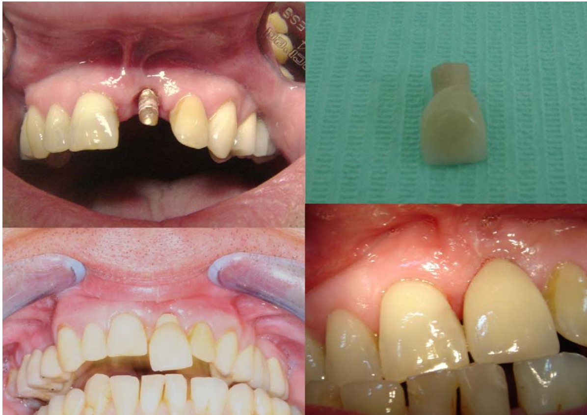
▲ Figure 4. Selected stages of implant-prosthetic treatment carried out by Prof. Paweł Piotrowski on a patient with a missing tooth 21: A) intraoral photo - individual dental implant abutment; B) ceramic prosthetic crown; C) stage of attaching the prosthetic crown to the implant; D) magnified intraoral photo - the implant-prosthetic treatment met the patient's aesthetic expectations

▲ Rycina 4. Wybrane etapy leczenia implantoprotetycznego przeprowadzonego przez dr. hab. Pawła Piotrowskiego u pacjenta z brakiem zęba 21: A) zdjęcie wewnątrzustne - indywidualny łącznik protetyczny zamocowany na implancie; B) ceramiczna korona protetyczna; C) etap mocowania korony protetycznej na implancie; D) zdjęcie wewnątrzustne w powiększeniu - leczenie implantoprotetyczne spełniło oczekiwania estetyczne pacjenta